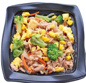
シーチキンと彩り野菜炒め（219円：税込）

あっさりした鶏ダシのスープに、人参やコーンをトッピングしました。春雨入りでボリュームがあり、不足しがちな野菜をしっかり採れる、ヘルシーなメニューです。