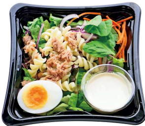
ヨーグルト風味のシーチキンマカロニ（298円：税込）

今回発売する商品は、クックパッドで募集した「ローソンセレクト シーチキン L フレークを使った“朝ごはんレシピ”」をアレンジしたものです。投稿された 350 件以上のレシピの中からお惣菜メニューとして 3 品を発売します。